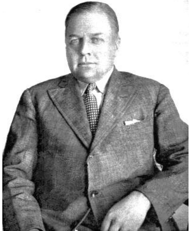
El general e ingeniero Enrique Mosconi se enfrentó a la sinarquía internacional, para tratar de unir y desarrollar a las naciones de Iberoamérica mediante la afirmación del principio de la soberanía nacional y la construcción de infraestructura.

Como les decía, Bolivia adopta el método de Mosconi de una empresa estatal energética, y se funda YPF de Bolivia.