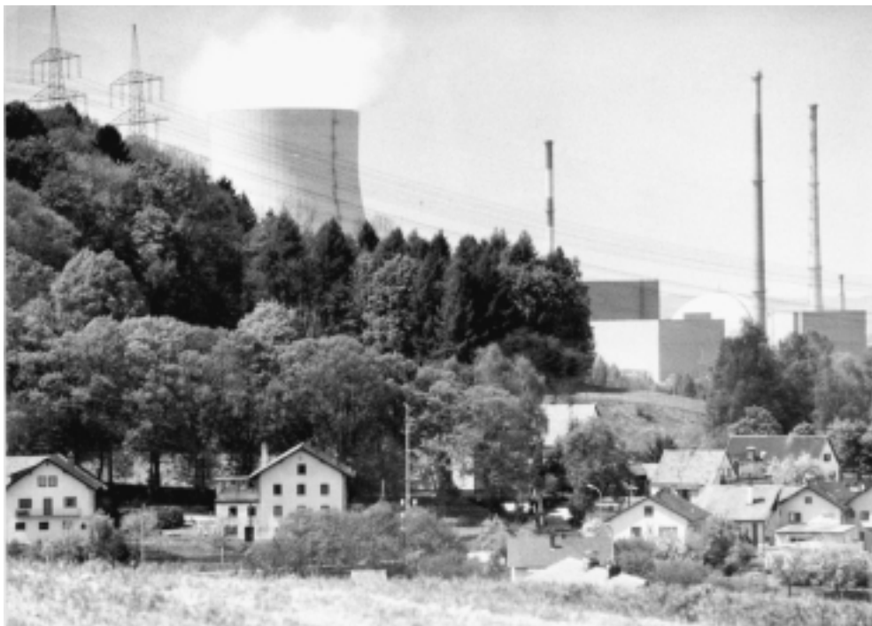
“Ahora la lucha es por la energía nuclear, que no está tan vinculada a una materia prima como el caso del petróleo, sino que está más vinculada a las ideas, a la tecnología o a la infraestructura”. Planta nuclear en Niederbach bei Landshut, Alemania. (Foto: Bundesbildstelle).

el caso del petróleo, sino que está más vinculada a las ideas, a la tecnología o a la infraestructura. Porque la energía nuclear se basa más en plantas nucleares que en la mera extracción mineral. Ya no es tan voluminoso el aspecto mineral; es más importante el desarrollo a través de la máquina–herramienta, de la construcción de la infraestructura, que es necesaria para esto.